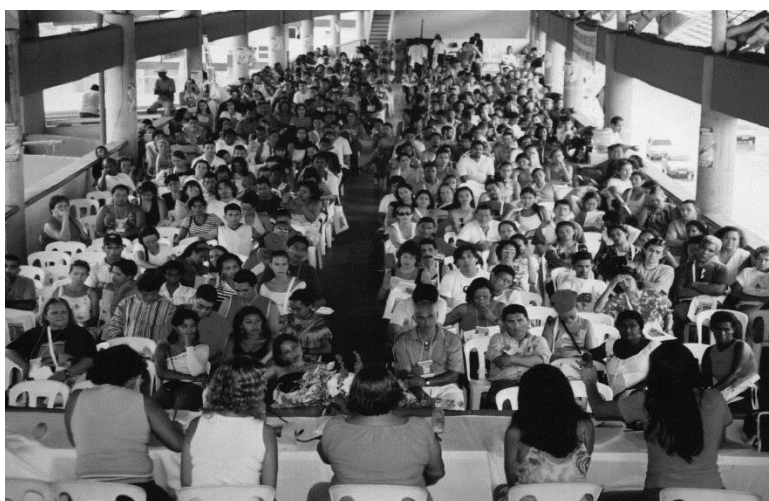
Foto 6 – 16º Congresso Estadual do SINTEPP (2003)